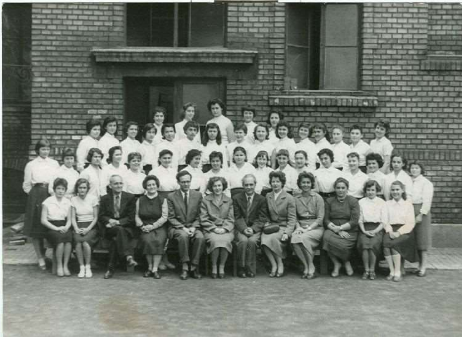
A 8. a osztály 1959-ben