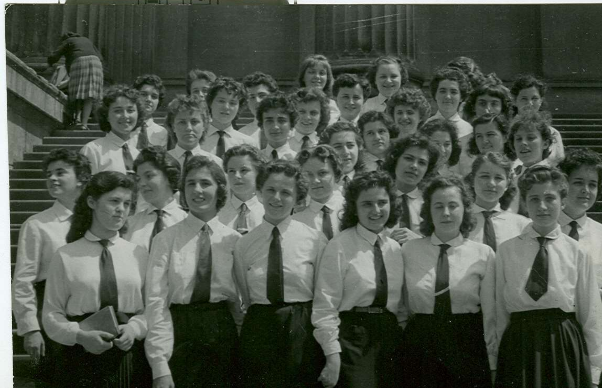
A ballagáskor a Nemzeti Múzeum előtt készült osztálykép az érettségiző leányosztályról 1958 -ból